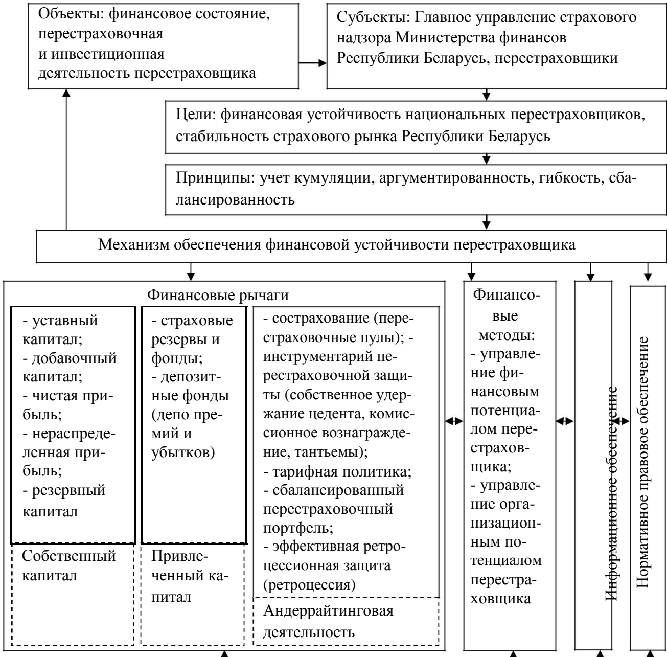
Рисунок 2. — Механизм обеспечения финансовой устойчивости перестраховщика

перестраховочной защиты (облигаторный, факультативный, смешанный договоры; пропорциональный и непропорциональный методы перестрахования); эффективная ретроцессионная защита; соответствующие депозитные фонды (депо премий и убытков). Применение предложенного механизма на практике позволяет: структурировать его основные элементы; раскрыть и описать факторы, влияющие на обеспечение финансовой устойчивости перестраховщика; разработать группы важнейших финансовых показателей, определяющие его финансовую устойчивость, и предложить методы их учета и анализа.